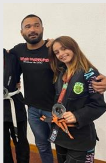
Ariana com o seu treinador