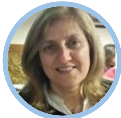
Vitória Mestre Matemática Secundário